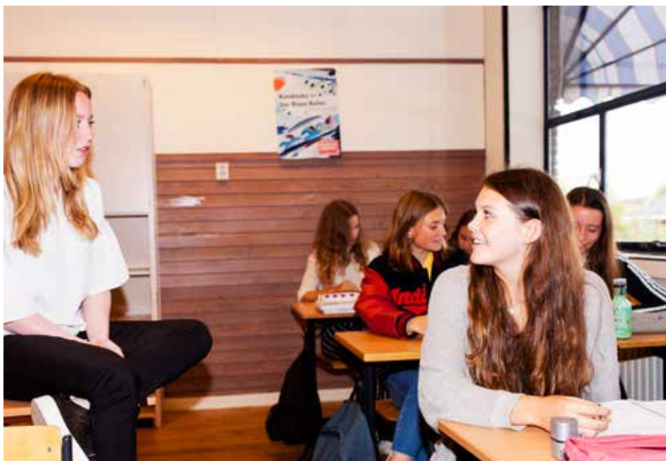
Over wat er speelt aan pesterijen zijn leerlingen vaak veel beter op de hoogte dan leerkrachten.

was en dat ze gewoon willen doorgaan. Mijn rol is die van motivator, ik geef veelal alleen maar complimenten.” En wat doe je dan als het na verloop van tijd wegzakt? “Dat heb ik pas één keer meegemaakt. Dan herhalen we het proces gewoon nog een keer.” Volgens ►