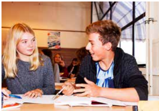
Als leerlingen betrokken worden bij het oplossen van pestgedrag verbetert de situatie vaak binnen een week.