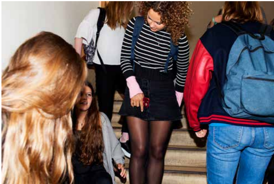
Simpele veranderingen kunnen de situatie voor een gepeste leerling verbeteren: diegene elke dag goedemorgen wensen of ernaast gaan zitten.